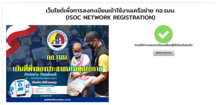
รูปที่ 7 แสดงหน้าจอลงทะเบียนเพื่อกรอกข้อมูลการเปลี่ยนผู้ลงทะเบียน

2.2.2 เมื่อผู้ลงทะเบียนกรอกข้อมูลตามข้อ 2.2 และตรวจสอบความถูกต้องแล้ว ให้คลิกที่เมนู “ยืนยันข้อมูล” ที่อยู่ด้านล่างของจอแสดงผล เพื่อส่งข้อมูลไปยังนายทะเบียนควบคุมระบบ