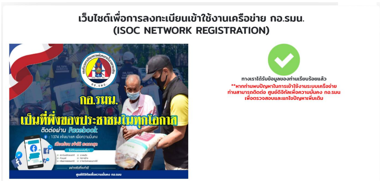
รูปที่ 3 แสดงหน้าจอยืนยันข้อมูลการลงทะเบียนสำเร็จ