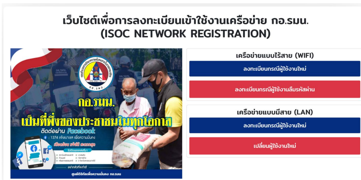
รูปที่ 1 หน้าจอการ Login “ https://wifi.isoc.go.th ”