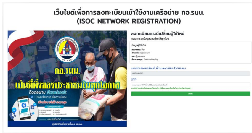
รูปที่ 6 แสดงหน้าจอลงทะเบียนเพื่อกรอกข้อมูลการเปลี่ยนผู้ลงทะเบียน

2.2.2 เมื่อผู้ลงทะเบียนกรอกข้อมูลตามข้อ 2.2 และตรวจสอบความถูกต้องแล้ว ให้คลิกที่เมนู “ยืนยันข้อมูล” ที่อยู่ด้านล่างของจอแสดงผล เพื่อส่งข้อมูลไปยังนายทะเบียนควบคุมระบบ